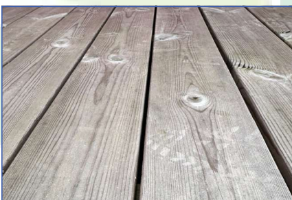
Træterrasse - Efter